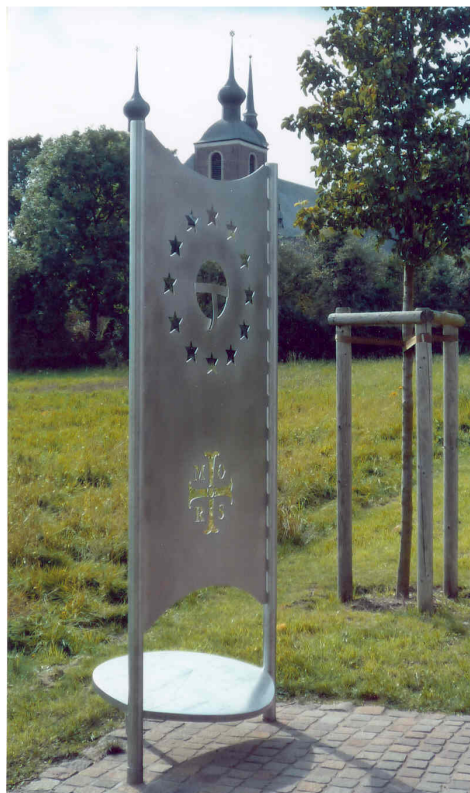
Wegmarke im „Alten Garten“

Liebe Mitglieder, sehr geehrte Damen und Herren!