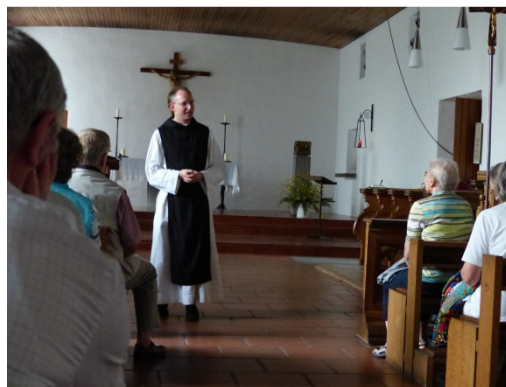
zum Zisterzienser-Kloster Langwaden

Die Tagesexkursionen nach Paderborn (Dom und Ausstellung CREDO),